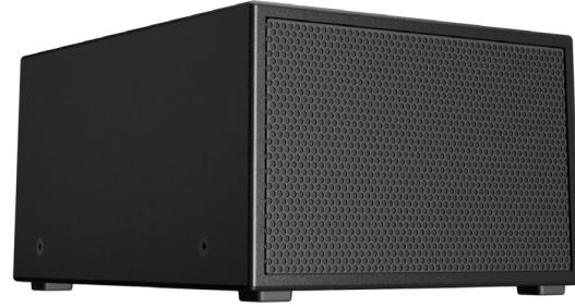
Q-SYS PL-SUB10 安装式无源重低音扬声器

Q-SYS PL-SUB10是一种安装式无源重低音扬声器, 采用10英寸换能器和防风雨 (IP54) 木质箱体。这款扬声器紧凑小巧, 适合各种应用, 从娱乐场所到企业礼堂或高校阶梯教室。PL系列高性能扬声器兼具Q-SYS传统的高性能音频处理能力以及强大的功能和灵活性, 能为前场应用提供始终如一的音视频及控制体验。